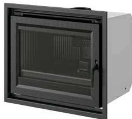
C-10 SE con marco de remate 4 caras