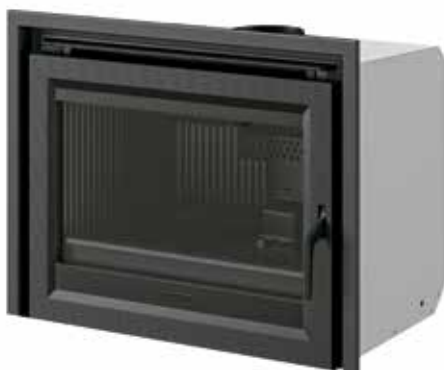
C-10 SE con marco de remate 3 caras